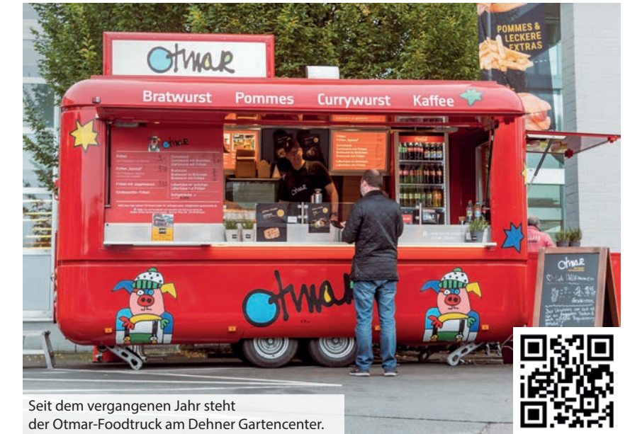
Seit dem vergangenen Jahr steht der Otmar-Foodtruck am Dehner Gartencenter.

Kommt vorbei und überzeugt Euch selbst von der Qualität und Freundlichkeit des Teams. Öffnungszeiten: Mo-Fr 12-18:45 h - Sa 12-17:45 - So geschlossen www.otmar.de sowie auf Facebook und Instagram