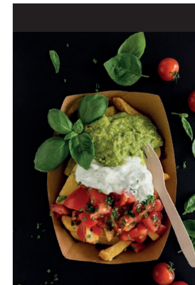
Neben der klassischen Currywurst und Pommes gibt es u.a. auch super-leckere Poutines, eine Spezialität aus Kanada.

Der bunte Imbiss des Handorfer Gastronoms Frank Bröker hat in 25 Jahren eine wahre Odyssee durch Münster erlebt – von der Arkaden-Baustelle an der Ludgeristraße bis vor den alten Bahnhofseingang, dann im Hauptbahnhof Münster und in Essen – bis Corona kam. Aufgrund des monatelangen Lockdowns mussten die Ladengeschäfte in den Hauptbahnhöfen geschlossen werden. Jetzt ist OTMAR endlich angekommen am Eingang zum Gartencenter Dehner in Handorf!