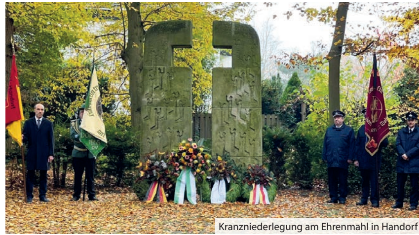
Kranzniederlegung am Ehrenmal in Handorf