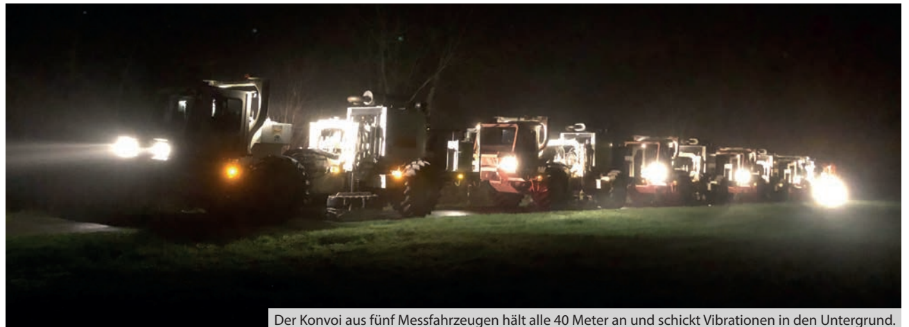
Der Konvoi aus fünf Messfahrzeugen hält alle 40 Meter an und schickt Vibrationen in den Untergrund.

Ein stattliches Aufgebot hatte sich bereits am 4. November in Kasewinkel versammelt: Presse, Regionalfernsehen, Zuständige aus Behörden und von den Stadtwerken, Projektbeteiligte. Beim Parameter-Test schickten fünf Messfahrzeuge, sogenannte Vibro-Trucks, über mehrere Stunden Schallwellen in den Boden. So konnten die Techniker testen, ob alle Geräte