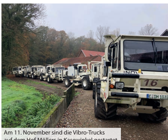
Am 11. November sind die Vibro-Trucks auf dem Hof Möllers in Kasewinkel gestartet.

Das zentrale Münsterland wurde für das Vorhaben als Pilotregion ausgewählt, weil bereits vorliegende geologische Daten aus den 1960er und 1980er Jahren darauf schließen lassen, dass es Kalksteinformationen in unterschiedlichen Tiefen gibt. Nun soll mit einem „Schnitt“ durch die Erdschichten erkundet werden, wie diese genau verlaufen. Ein weiterer Grund für die Durchführung der Messungen hier im Münsterland war, dass der Wärmebedarf vor allem in Münster hoch und bisher nur zu einem Teil aus regenerativen Quellen gedeckt ist. So wären auch Abnehmer für die Wärme vorhanden. Grundlage für das Projekt ist der fraktionsübergreifende Landtagsbeschluss „Wärmepotenziale nutzen – Einsatz der Geothermie erleichtern“ vom 20. März 2019.