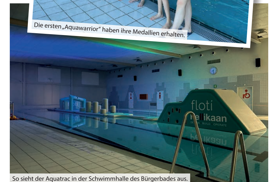
So sieht der Aquatrac in der Schwimmhalle des Bürgerbades aus.