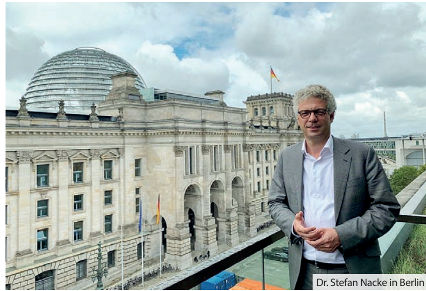
Dr. Stefan Nacke in Berlin

Gerne möchte ich meine ersten Wochen in Berlin mit Ihnen und Euch teilen. Der Umzug vom Nordrhein-Westfälischen Landtag in den Deutschen Bundestag bringt vieles Neue mit sich. In Berlin ist alles ein bisschen größer und weitläufiger, und im Reichstagsgebäude spürt man förmlich die Geschichte sowie die Verantwortung, die wir Abgeordneten für das gesamte Land tragen. Von meinen neuen Kolleginnen und