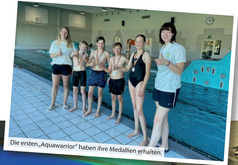
Die ersten „Aquadwarrior“ haben ihre Medallien erhalten.