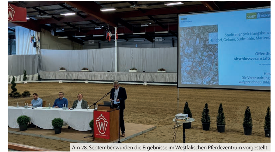
Am 28. September wurden die Ergebnisse im Westfälischen Pferdezentrum vorgestellt.